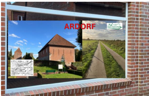
(Kirchstraße, Durchgang zum Kirchplatz)