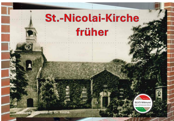
(Kirchstraße, Durchgang zum Kirchplatz)